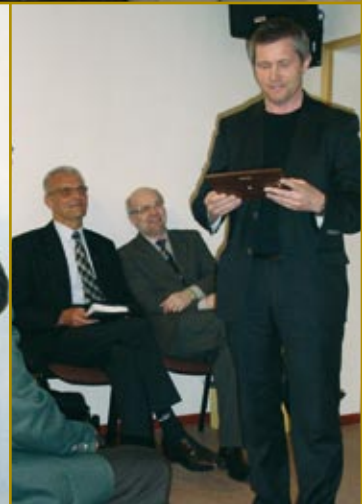
Spółeczność Chrześcijańska w Lidzbarku Welskim poświęcenie nowej siedziby, 2 maja 2010