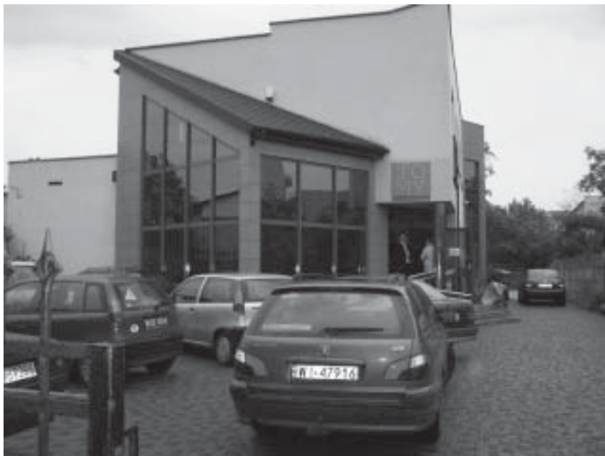
Aktualne wynajmowane miejsce zgromadzeń

W marcu 2004 roku odbyło się tam pierwsze nabożeństwo. – Od samego początku marzyliśmy, aby to miejsce w ciągu kilku lat zamieniło się w chrześcijański